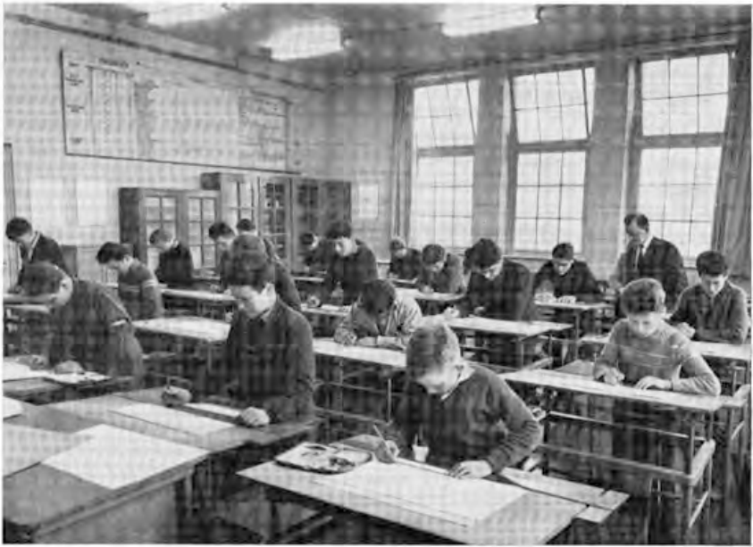
De klas Werktuigbouwkundig tekenen.