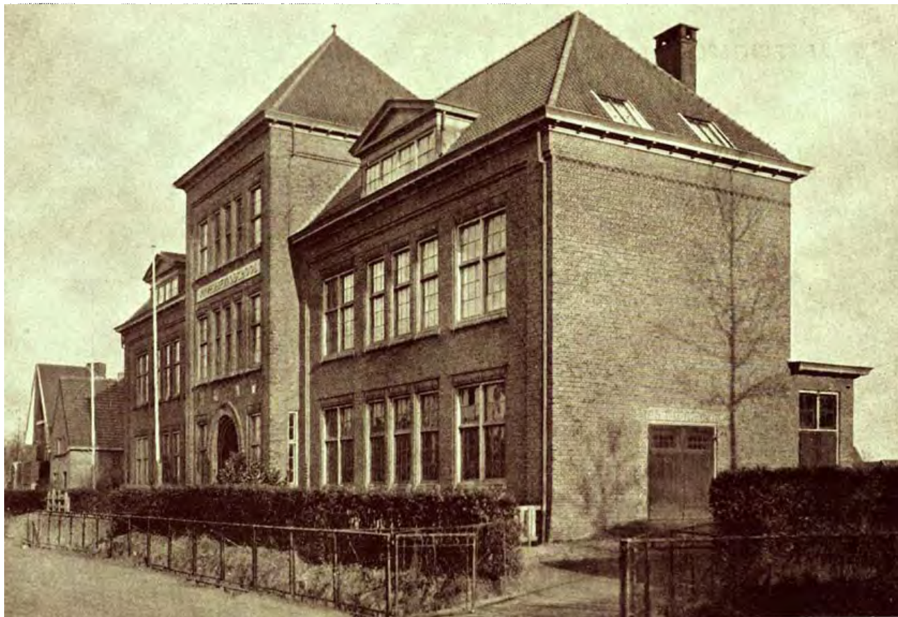
De school in 1922 (Voorzijde)