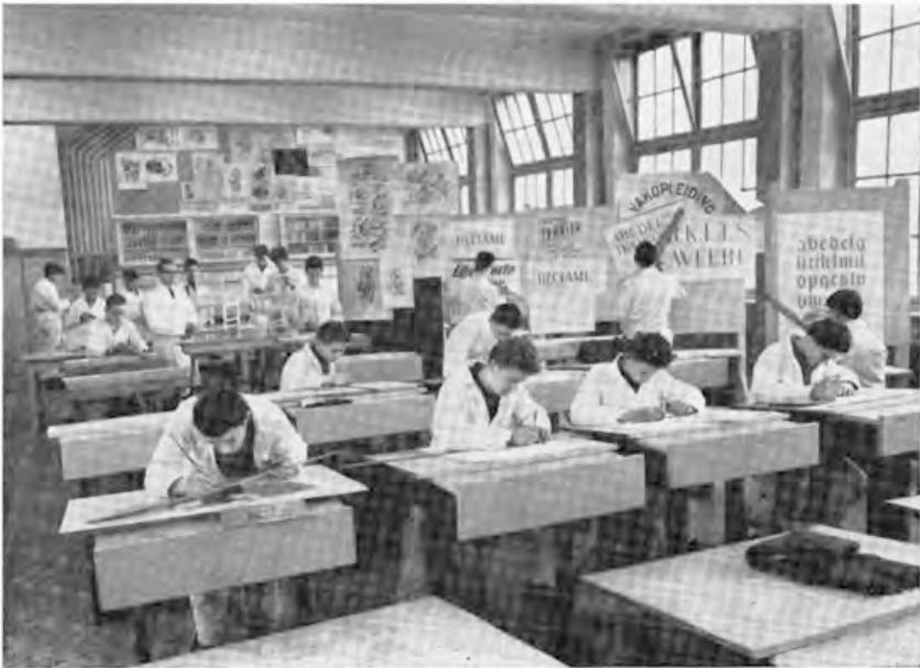
De afdeling Schilderen.