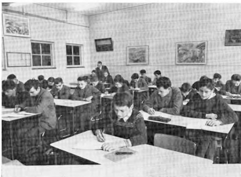
De leraar tracht zijn leerlingen inzicht te geven in meetkundige problemen.