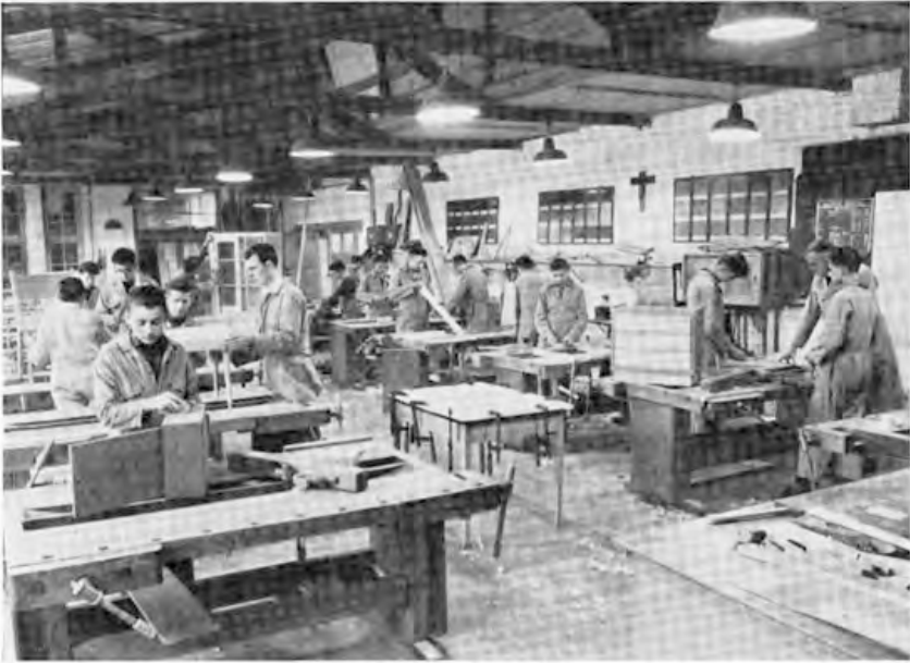
De afdeling Meubelmaken.