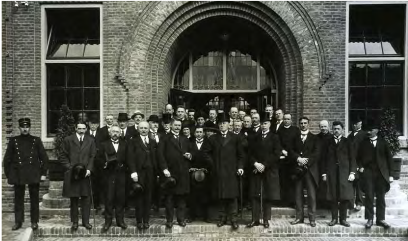
Officiële opening van de school 11 mei 1922.