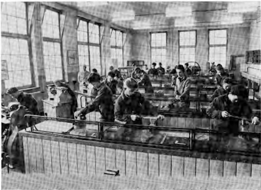
De 2e klas Bankwerken.