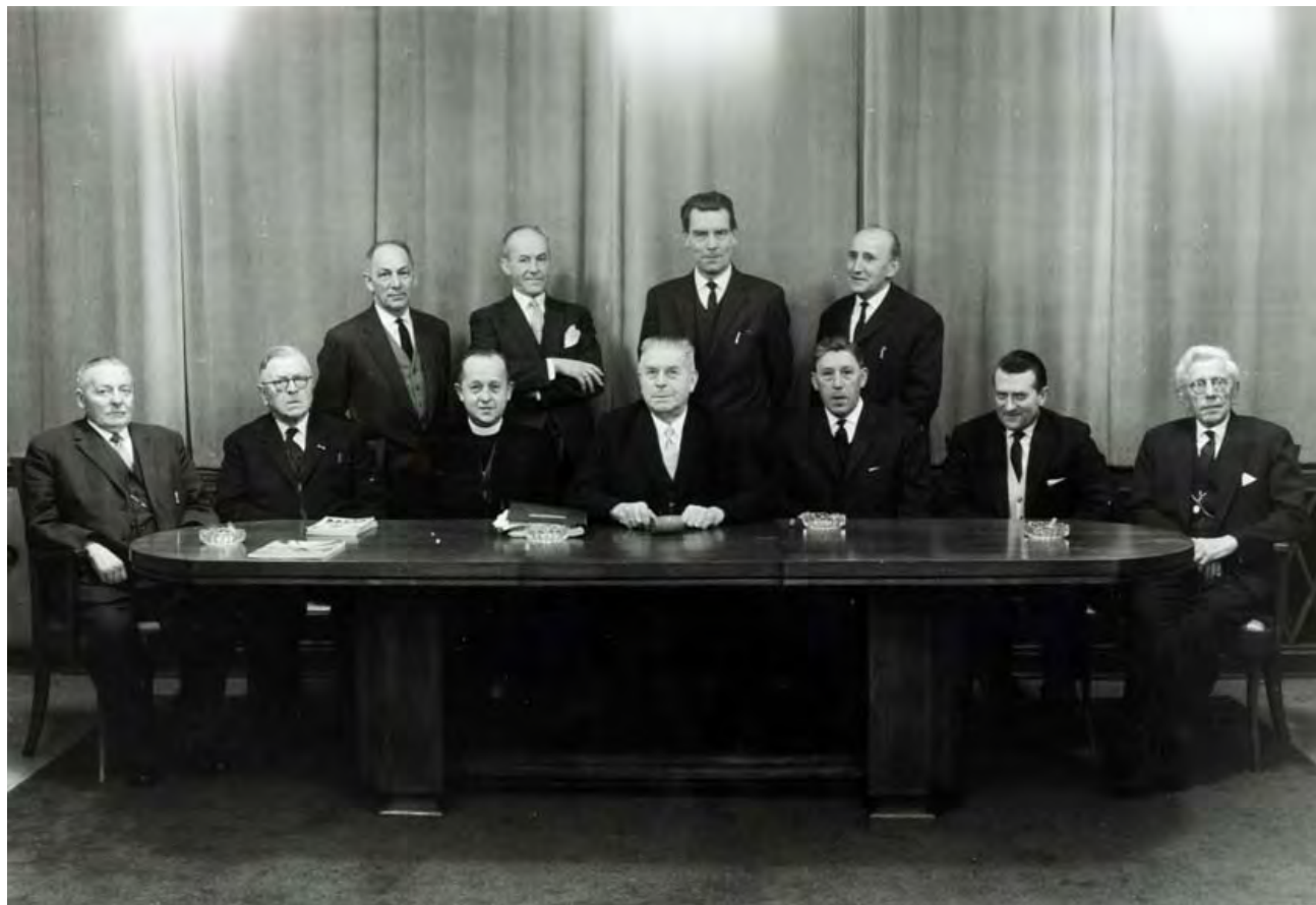
Het schoolbestuur in 1962.