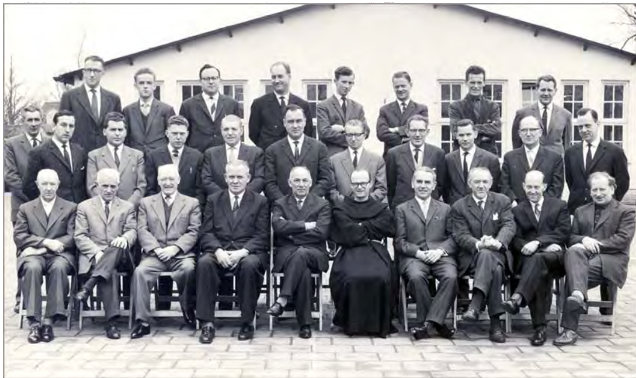
Het personeel van de dagschool in 1962.