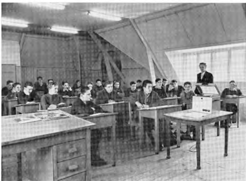
Muzikale vorming. De leraar leert zijn leerlingen het „beluisteren van muziek“.