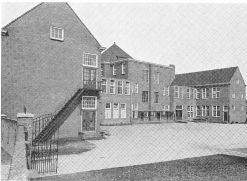
De achterzijde van de school na de uitbreiding in 1954