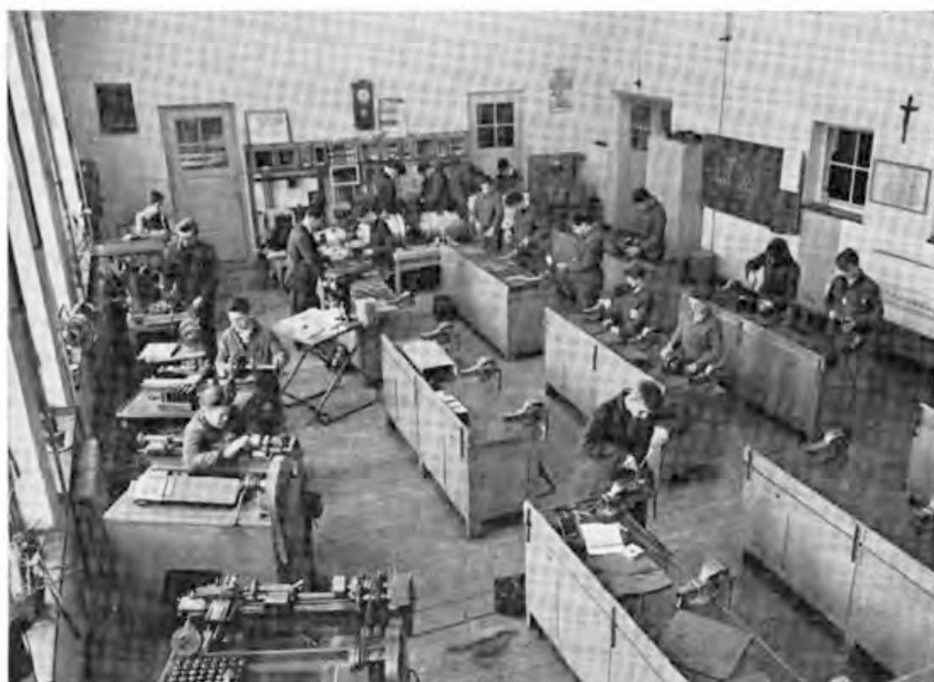
De afdeling Elektriciens.