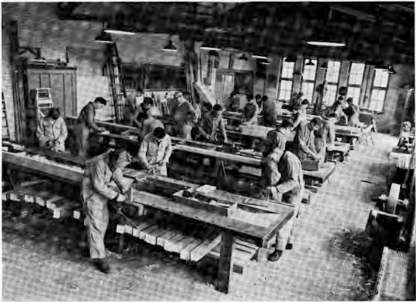
De 2e klas van de afdeling Timmeren.