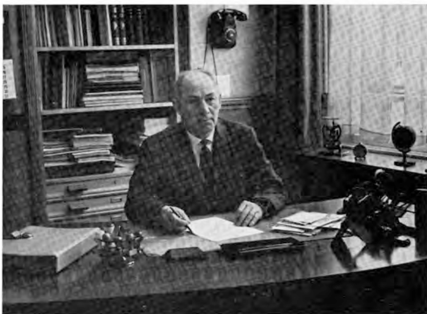
De directeur in zijn werkkamer.