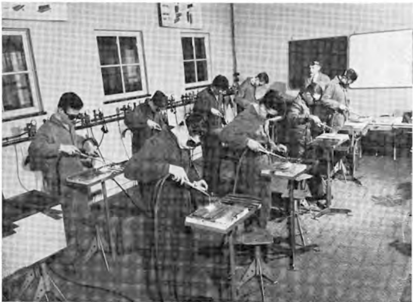
De Lasserij : „Autogene metaalbewerking“.